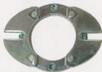
羽根式バックプレート