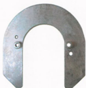
馬蹄式バックプレート